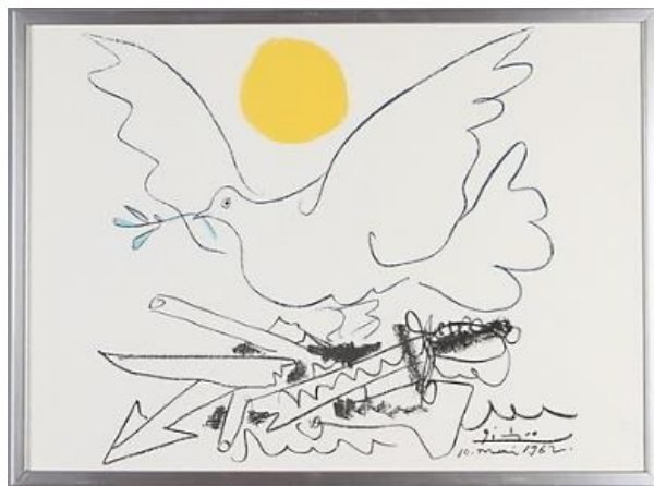
Worldwide! – also Gaza