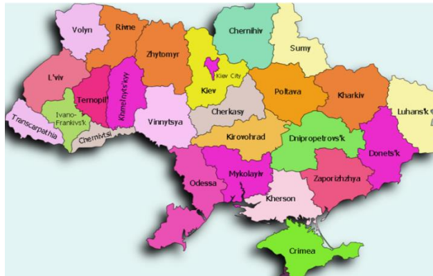
Ukraine for ever