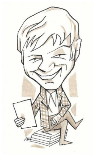
Fecit Stanislav Hlinovsky, CZ, 1972