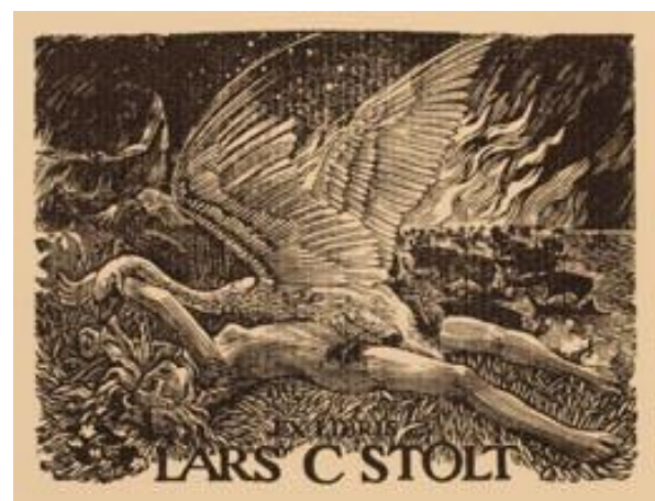
Simon Brett for Lars C. Stolt

http://www.bookplatesociety.org/news_events.htm