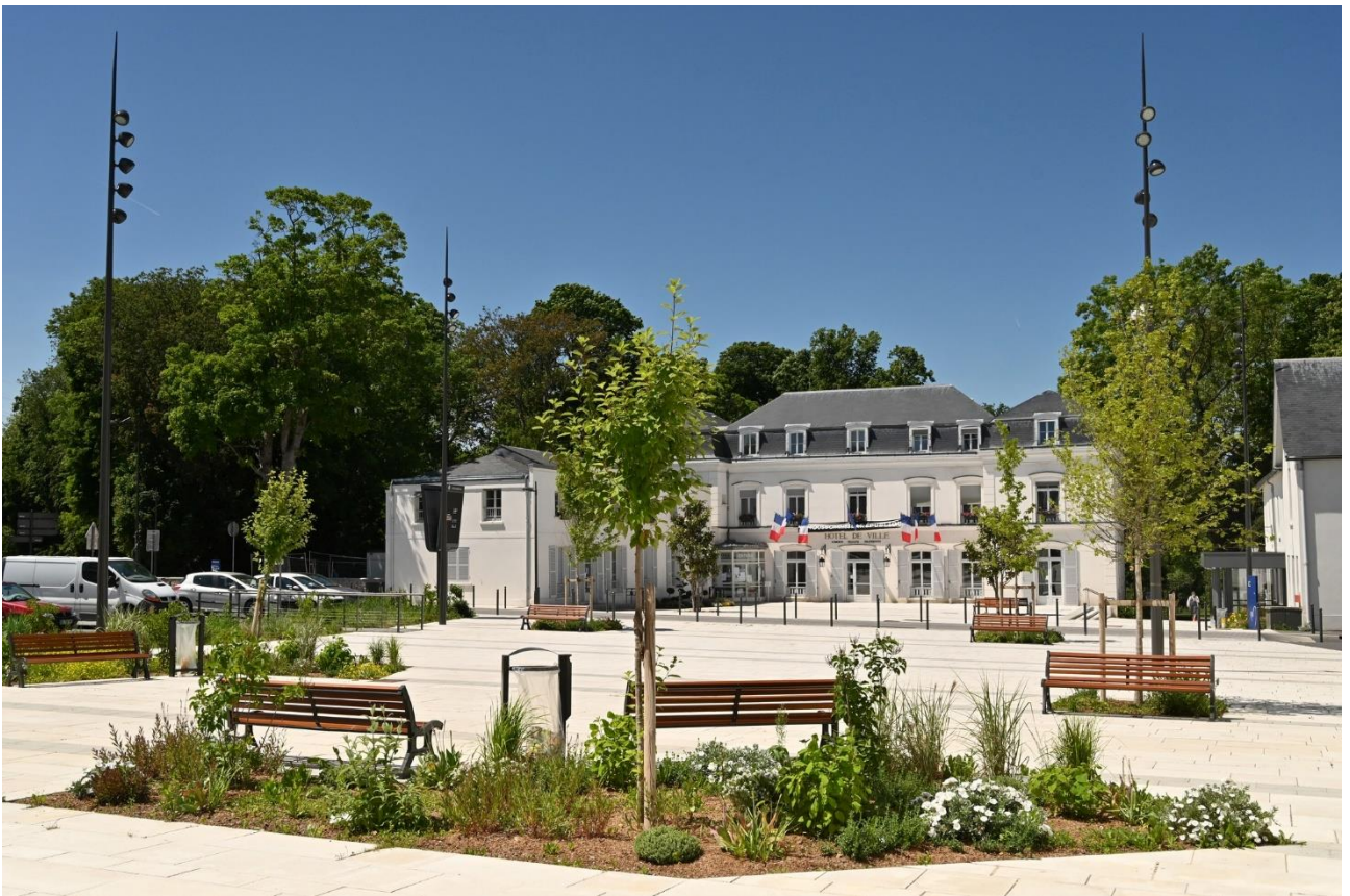
Ville de Saint -Michel sur Orge