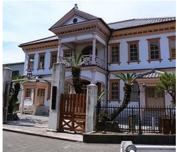
Umetarō Azeci Memorial Museum