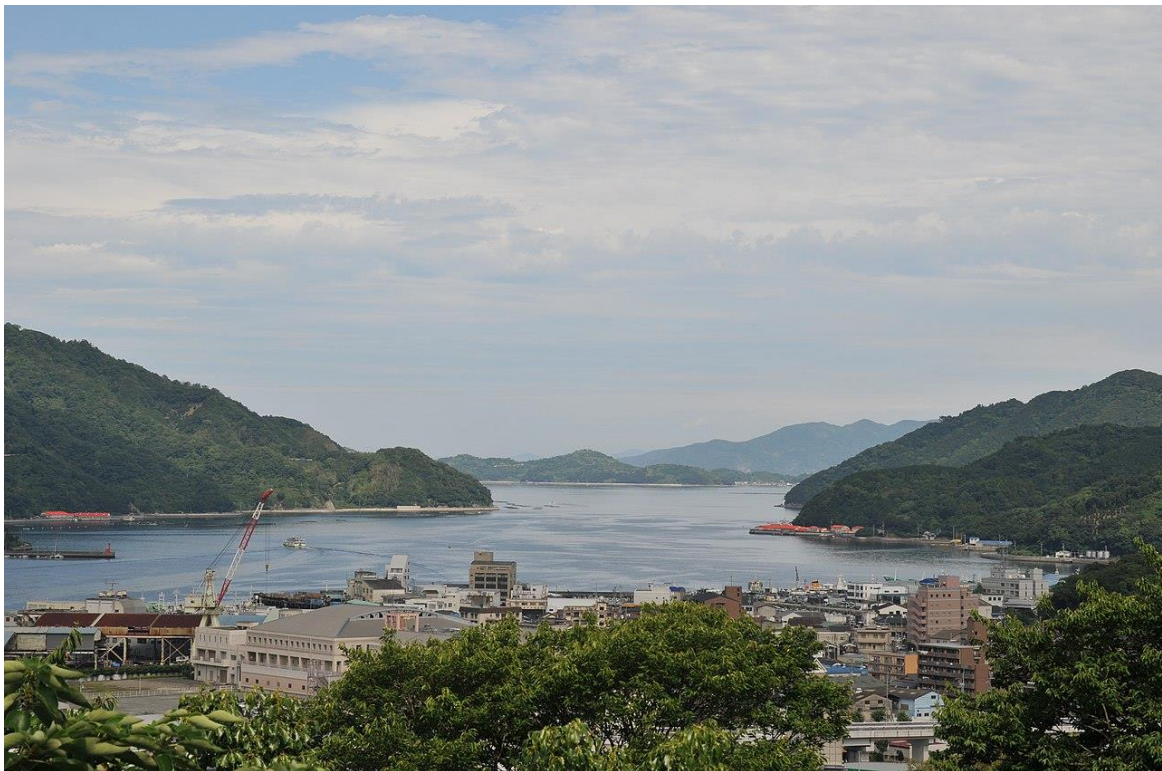
View of Uwajima Bay and downtown Uwajima from Uwajima Castle