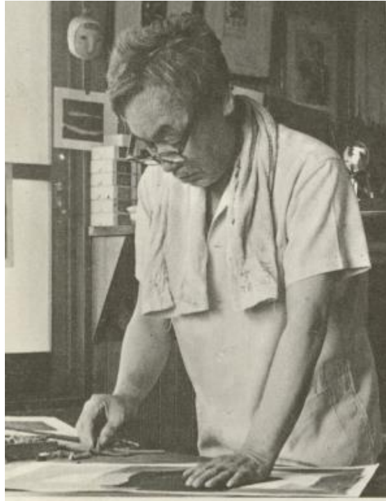
Umetarō Azechi (1965)

Umetarō Azechi (畦地 梅太郎), December 28, 1902 - April 12, 1999) was a Japanese printmaker and mountain climber. He was known for his prints of mountains and people who live in them.