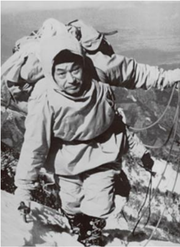
Azechi maintained a vigorous lifestyle well into his 90's.