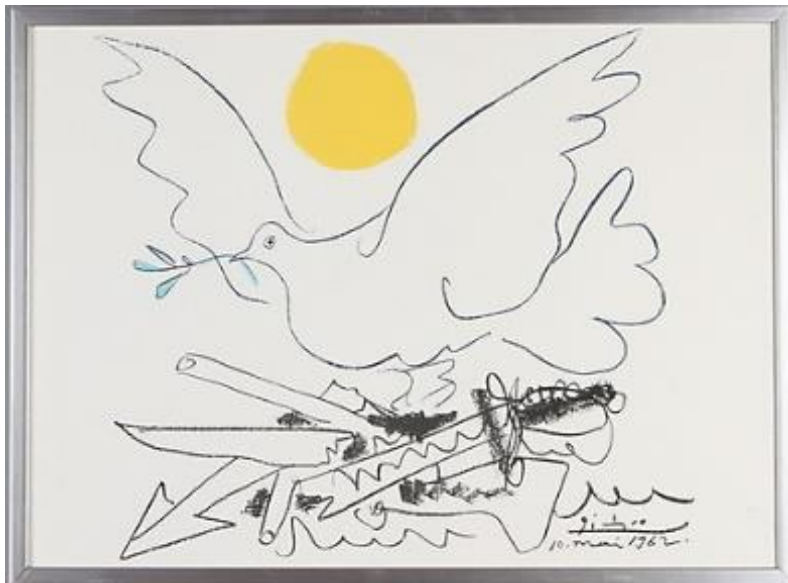
Worldwide! – also Gaza