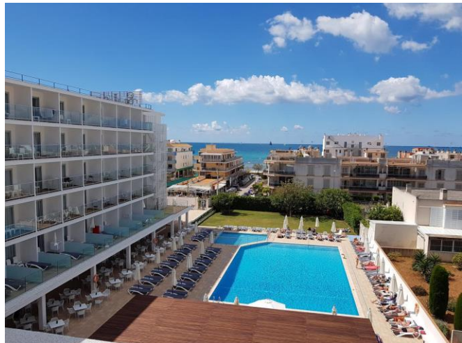
Congress Hotel Alua Leo Palma de Mallorca